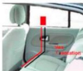
Kablerne trækkes så transponderen nemt kan tilsluttes strøm.

På youtube.com kan du finde flere videoer, søg på "balise chronopist" eller kig på chronopist.com (hjemmeside på fransk)